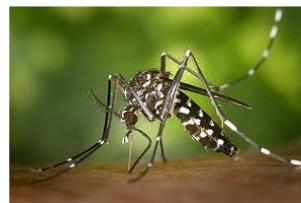
1: Asiatische Tigermücke